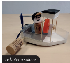
Le bateau solaire

Venez construire en famille un bateau solaire fonctionnant à l'énergie solaire, que vous ramènerez en souvenir