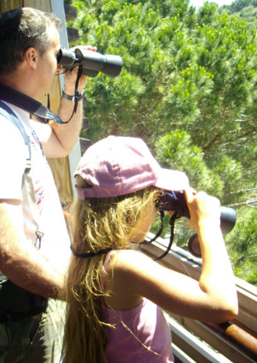
Observations naturalistes dans le Site classé de l'Anse de Paulilles.