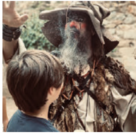
Les Journées médiévales

Durant ce week-end extraordinaire, le Château et ses jardins feront un saut dans le temps pour replonger à l'époque médiévale. Un campement sera installé dans les jardins où se côtoieront chevaliers, armuriers et paysans. La catapulte à bonbons fera le bonheur des plus jeunes qui pourront aussi passer par l'atelier maquillage ! Et que seraient les Fêtes médiévales sans ses troubadours et ménestrels pour animer cours et jardins