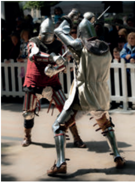
Les Journées médiévales