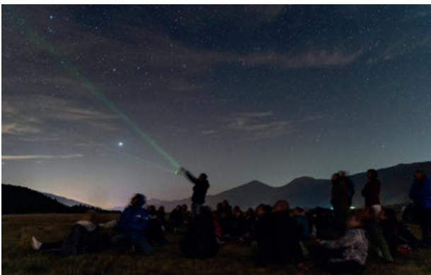
Les nuits des étoiles - Photo : Cyril Clavet

Conte, musique et drôles d'histoires sur les plantes, leur magie et la sorcellerie