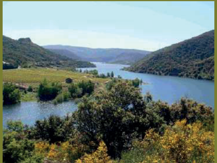
Figure 1 - Photographie du lac de l'Agly

Le cadre paisible et authentique du site, la préservation et la beauté des paysages, ainsi que l'intérêt grandissant que le public porte à ces lieux, ont contribué à sensibiliser le Département sur l'intérêt d' aménager les abords du lac pour y développer les loisirs et le tourisme. De plus, des études économiques et touristiques réalisées entre 2012 et 2014 ont démontré les attentes fortes du public pour le développement de telles activités. C'est ainsi que depuis 2007, des aménagements dédiés au tourisme de nature dans un secteur des Pyrénées-Orientales qui ne ne bénéficiait pas encore de site naturel touristique majeur structuré, ont été réalisés par le Département en faveur de plusieurs activités : pêche, randonnée nature et découverte patrimoniale.