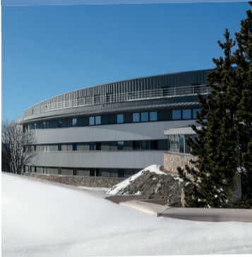
Le nouvel internat a été inauguré le 13 février.

Le Département, aux côtés de la Région, a participé à la rénovation de l'internat de la cité scolaire Pierre de Coubertin de Font-Romeu à hauteur de 1,7 M€. Ce site, de renommée internationale et vecteur d'attractivité pour la montagne catalane et le mouvement sportif, a été rénové et modernisé pour des conditions d'études optimales. Équipé de panneaux photovoltaïques assurant près de 80 % d'autoconsommation, ce nouvel internat s'inscrit dans la stratégie départementale de développement d'activités « 4 saisons ».