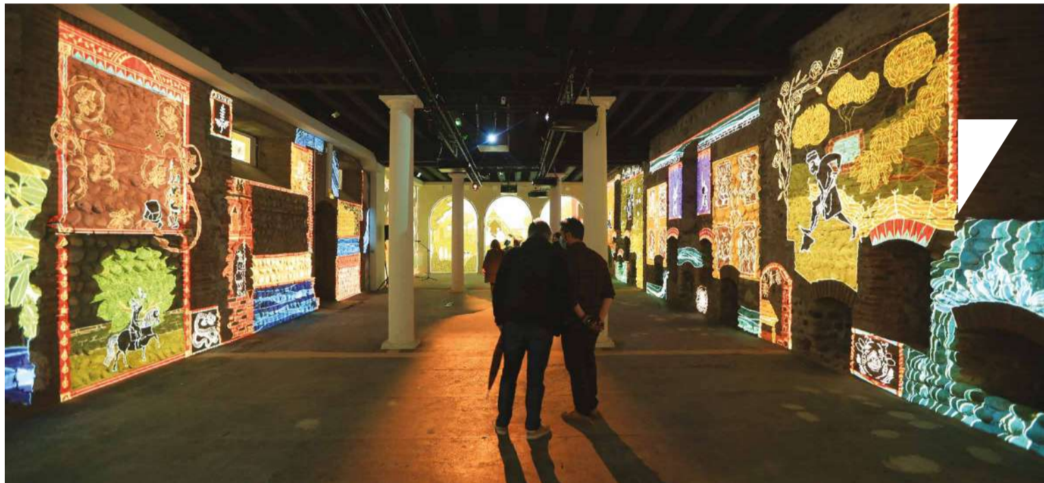
Ce spectacle immersif invite les visiteurs à se plonger dans les jardins du XIV e siècle grâce à un outil numérique de projection d'images sur les murs de la salle.

J'ai testé pour vous le nouveau spectacle immersif du Palais des rois de Majorque « Jardins enlumines. Jardins il-luminats » créé par le Département : exceptionnel !