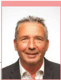
Alexandre REYNAL Groupe SOCIALISTE, ÉCOLOGISTE ET RÉPUBLICAIN