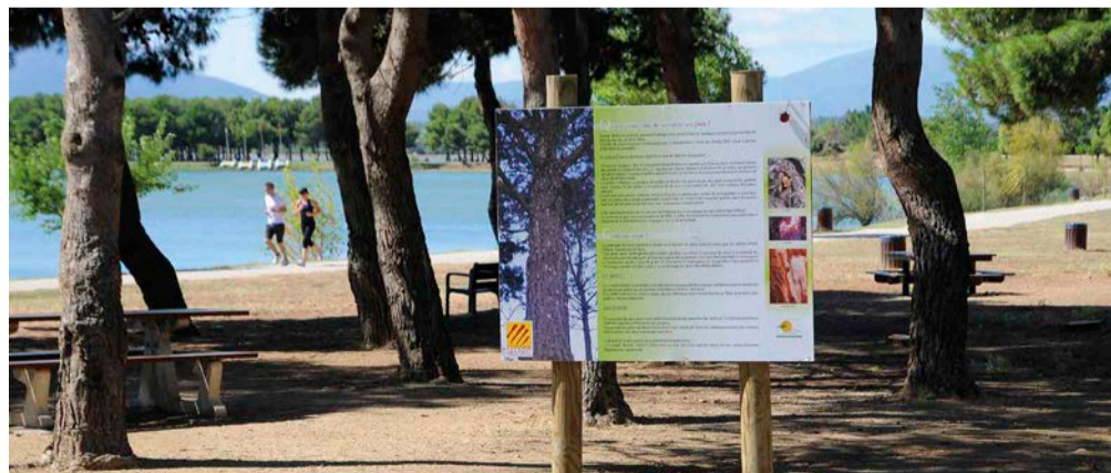
Le site du lac de la Raho

Le site de Paulilles accueille le public depuis le 21 mai. Un sens de circulation y a été aménagé afin d'éviter le croisement des visiteurs, et un point d'accueil est installé devant la Maison de site, momentanément fermée. L'atelier des barques est ouvert, et les visites guidées du site reprendront bientôt en groupe limité. Le sentier sous-marin de Peyrefitte ouvrira le 1 er juillet (sans location de masques et tubas). Le site du lac de la Raho