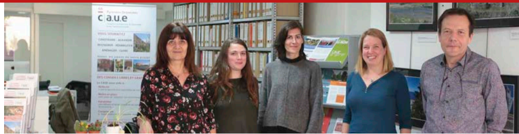
L'équipe du CAUE 66 à Perpignan.

Archives départementales 74, avenue Paul Alduy Perpignan Tél. 04 68 85 84 00 archives@cd66.fr Pour l'heure, ouverture uniquement pour les professionnels et les chercheurs scientifiques sur rendez-vous. Service archéologie : archeologie@cd66.fr Routes État des routes, chantiers gestion du trafic, numéro d'alerte. Serveur vocal : 04 68 38 12 05