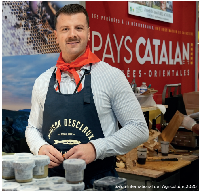
Salon International de l'Agriculture 2025