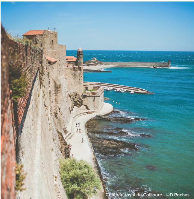
Château royal de Collioure