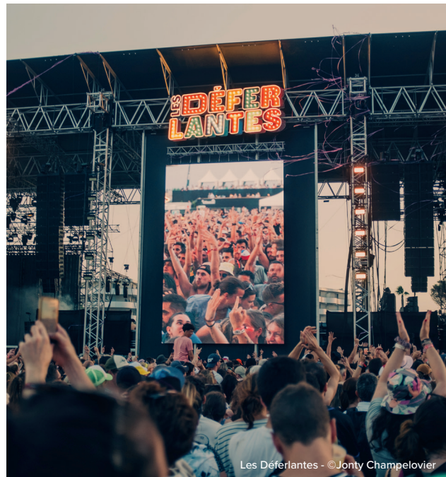
Les Déferlantes