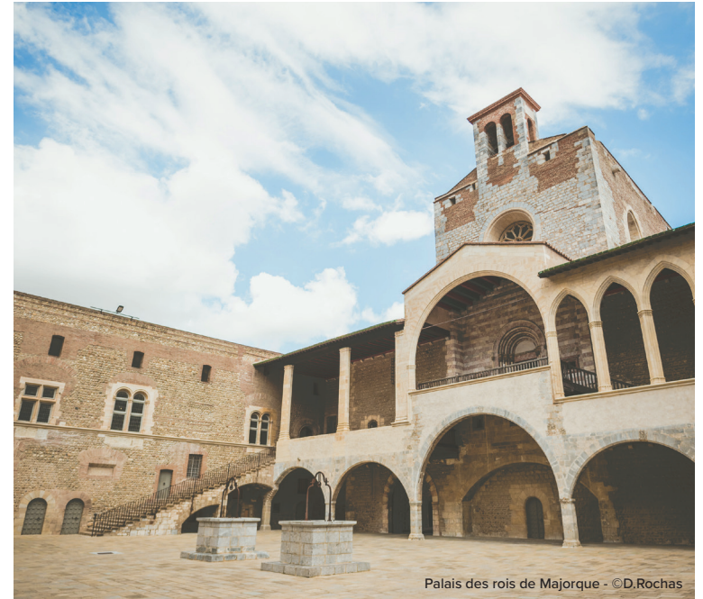
Palais des rois de Majorque