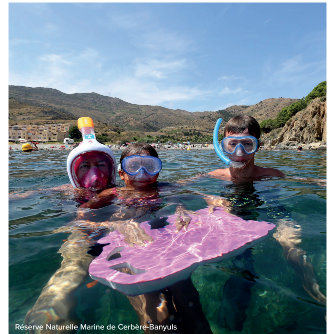
Réserve Naturelle Marine de Cerbère-Banyuls