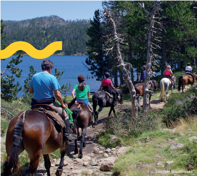
Lac des Bouillouses