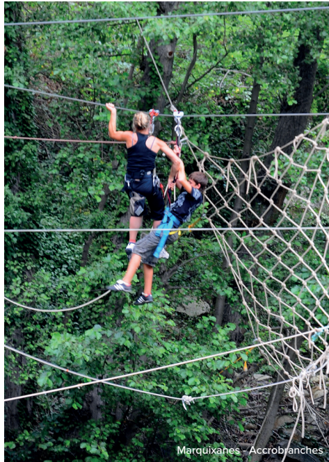
Marquixanes - Accrobranches