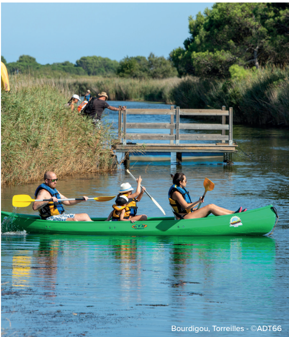
Bourdigou, Torrelles