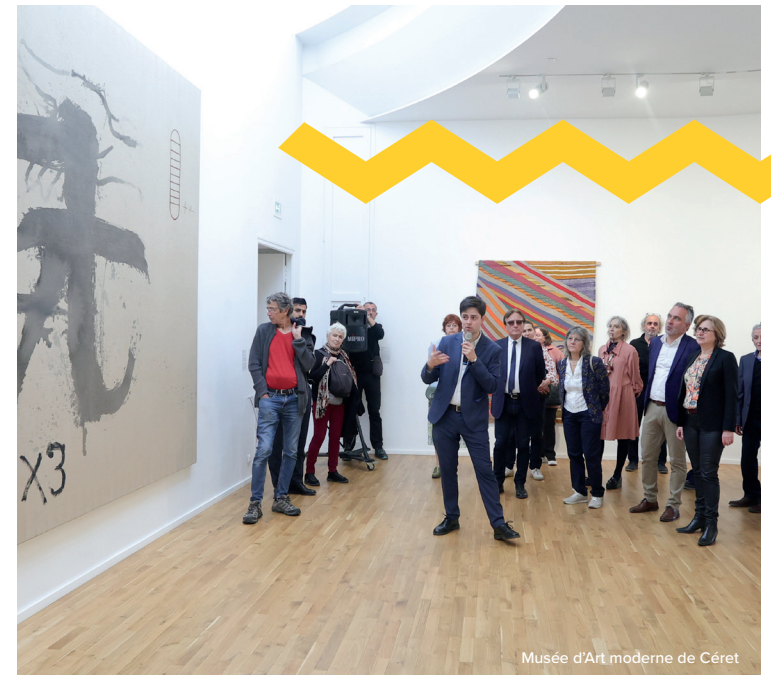
Musée d'Art moderne de Céret