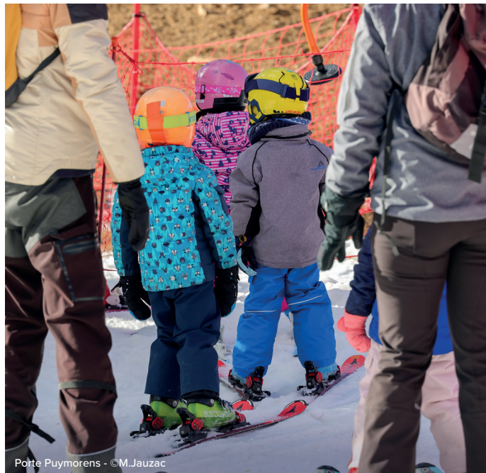
Porte Puymorens