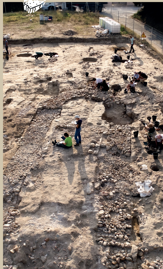
Le chantier durant la campagne de fouille de juillet 2024

> 17h15 - 17h30 : Discussions et clôture.