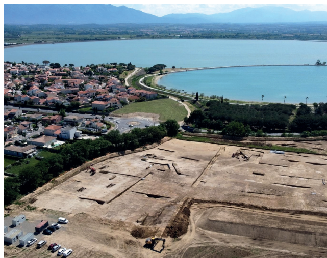
Les fouilles de la Zac du Golf à Villeneuve-de-la-Raho (Inrap)

La Direction Régionale des Affaires Culturelles Occitanie / Service Régional de l'Archéologie et le Département des Pyrénées-Orientales / Service Archéologique Départemental organisent la huitième journée d'archéologie départementale où sera présenté le résultat des opérations d'archéologie préventive et programmée menées dans le département en 2024 et 2025. Cette manifestation est organisée grâce à la participation de l'Inrap, d'ACTER et du CNRS.