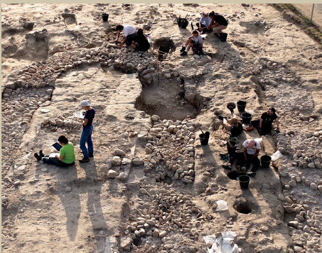
Les fouilles de Palol à Elne (SAD)