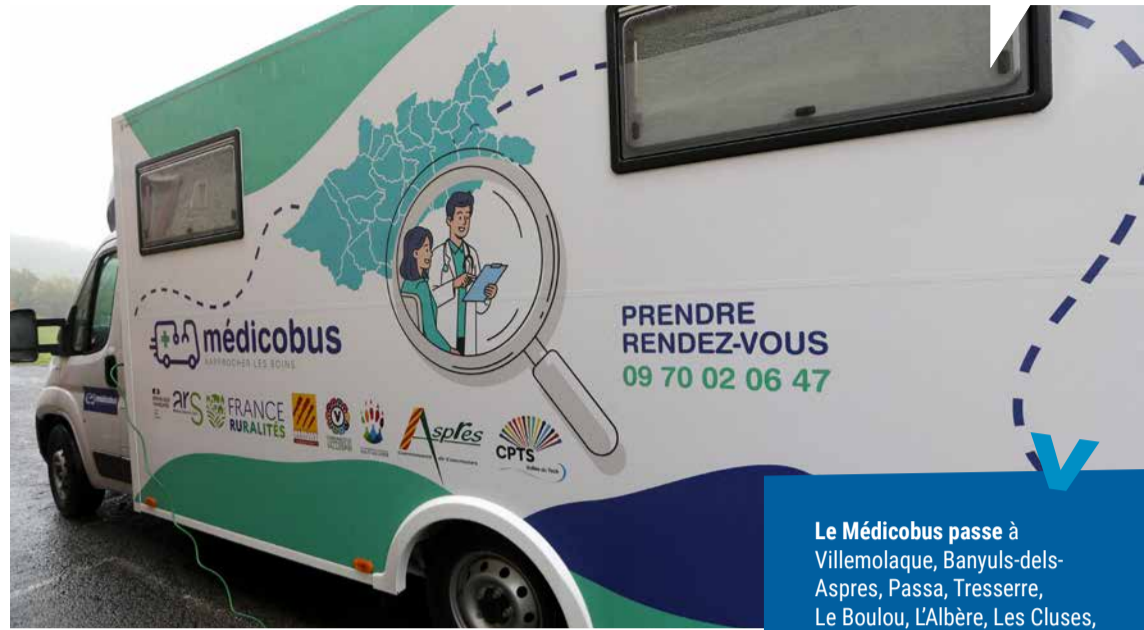
Le médicobus a été lancé officiellement, le 6 novembre dernier, à Saint-Marsal.

Depuis quelques mois, un drôle de bus sillonne le Vallespir et une partie des Aspres : il s'agit d'un Médicobus*, comprenez un bus médical qui propose des consultations au plus près de chez vous. Cette initiative pas banale est apparue à l'automne 2025. Projet expérimental pour une durée de 3 ans, le Médicobus s'adresse prioritairement aux personnes sans médecin traitant, aux personnes âgées ou en affection longue durée, aux bénéficiaires de la Complémentaire Santé Solidaire (CSS) et plus largement à tout habitant en difficulté d'accès aux soins. Il vient là où il n'y a pas de cabinet médical ou en complément de l'offre existante. Cabinet médical itinérant, de proximité, ce dispositif vise à apporter une réponse concrète au problème de désertification médicale dans les territoires les plus ruraux et ainsi réduire les inégalités d'accès aux soins. Le Département a voté 78 260 € pour l'achat et l'aménagement de ce Médicobus.