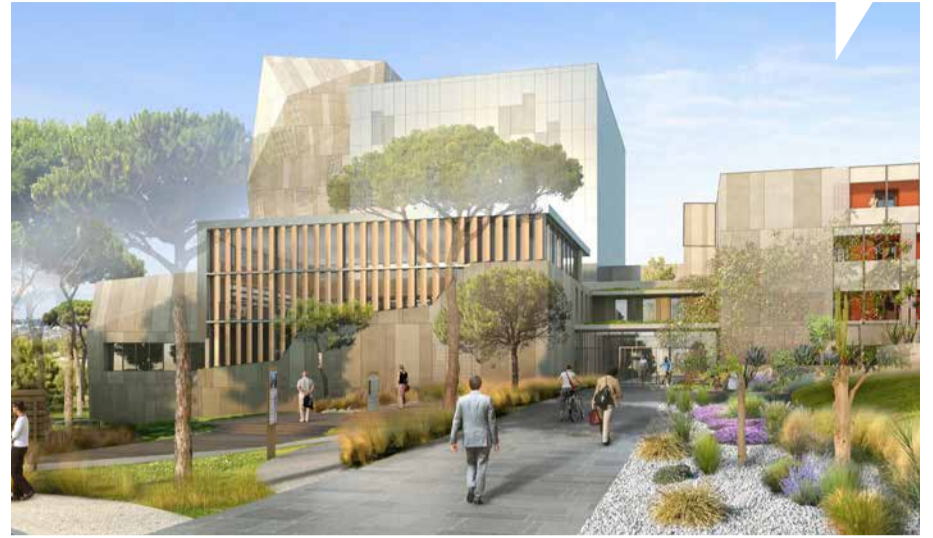
Le nouveau bâtiment des Archives départementales et de l'Archéologie à Perpignan sera livré en 2028. © Atelier des Mathurins Architectes

contact de leur public, dans les collèges, mais aussi au sein des Maisons sociales de proximité. Livraison totale du bâtiment complet : deuxième semestre 2028. Montant total du projet : 24 millions d'euros (cofinancés par l'État).