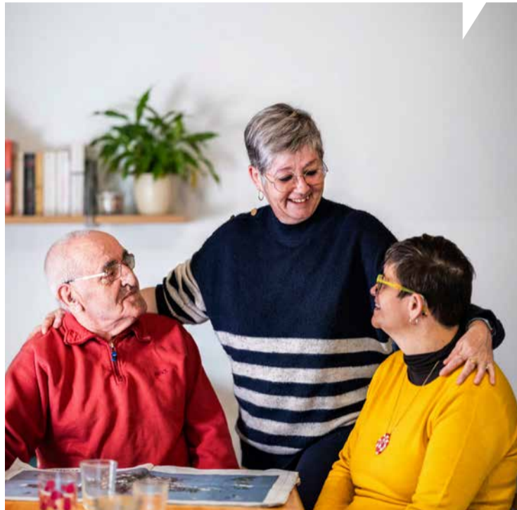
Accueillant familial, un métier, un engagement.

« À ce jour, 56 accueillants familiaux répartis sur l'ensemble du territoire sont agréés pour 127 places. Mais dans les cinq ans à venir, 25 de ces accueillants partiront à la retraite. C'est la raison pour laquelle le Département lance une vaste campagne de recrutement. Ce type d'accueil offre une alternative aux établissements spécialisés, offrant confort, convivialité et sécurité tout en préservant l'autonomie de la personne accueillie et lui permettant de rompre avec la solitude. »