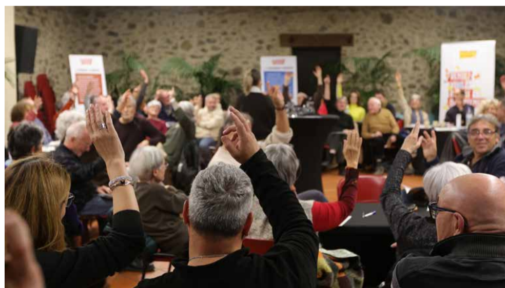
Échanger, débattre, s'informer... Le dialogue citoyen continue !

L'accès aux soins est une autre priorité avec le renforcement de l'offre sanitaire, en améliorant sa répartition territoriale et en répondant aux besoins liés au vieillissement