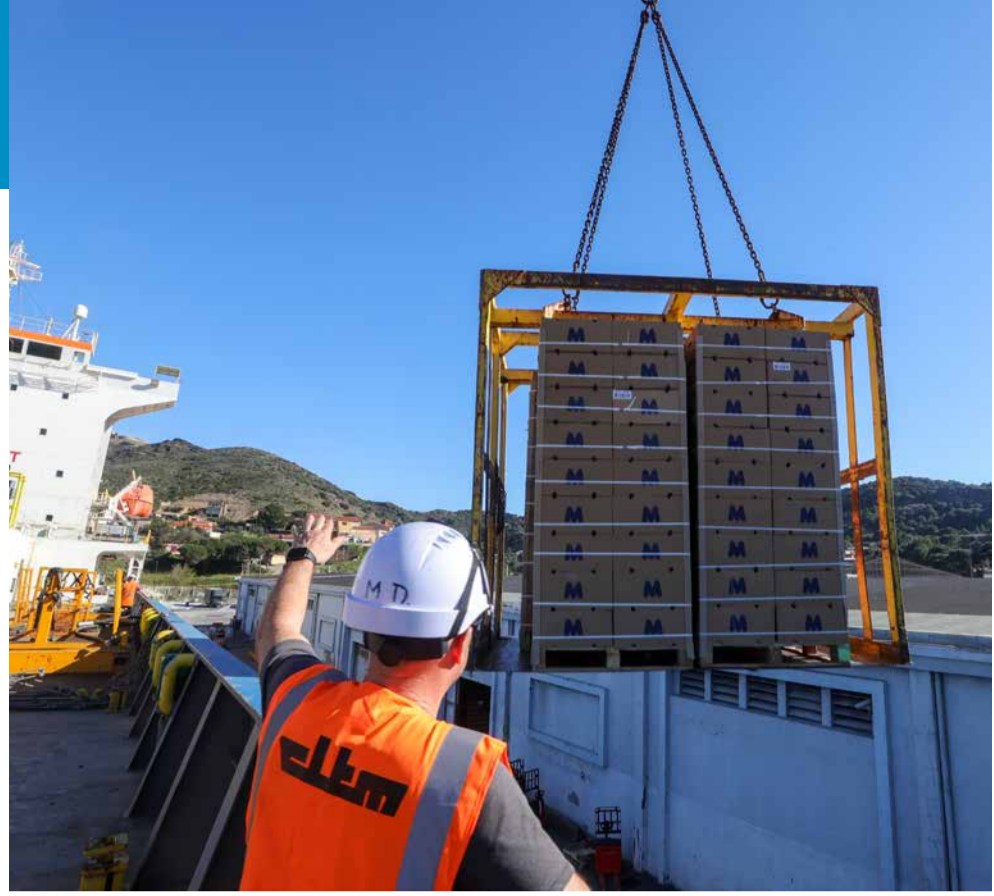
Les investissements pour le développement du port de Port-Vendres portent leurs fruits. L'activité commerciale est en plein essor.

d'investissements de 48 millions d'€ pour la période 2025-2031 permettant la réhabilitation et la modernisation de l'Anse Gerbal et des quais, la poursuite de la modernisation des infrastructures du port de commerce avec la création d'un nouvel hangar. Avec le développement de l'activité du port, c'est bien toute l'économie locale et les familles qui bénéficient de ce dynamisme. Plus de 600 emplois directs et indirects dépendent de l'activité du port.