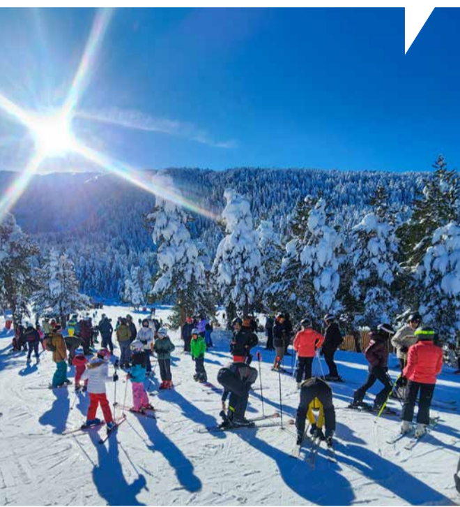
Des forfaits à prix mutualisés, des paysages féériques mais aussi des événements exceptionnels ont su séduire et attirer tous les publics.