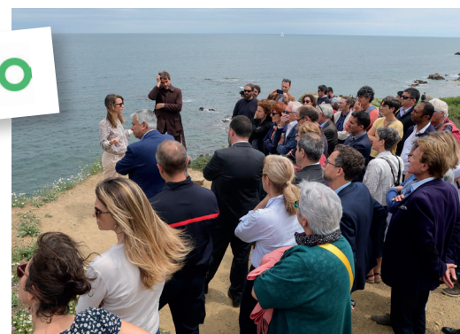
« Labo P.O », un outil d'aide à la décision. Visite de terrain le 27 mai 2024 au niveau des criques de Portells à Argelès-sur-Mer dans le cadre d'ateliers de travail « Labo P.O » réunissant élu-e-s locaux, experts et techniciens.